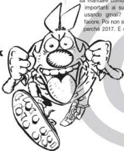
BUFALE IN RETE | LUPO ALBERTO

Speravamo davvero per un po' di non dover trattare ancora bufale riguardanti il più famoso social network del pianeta, ma evidentemente al peggio non c'è mai fine. Questa volta la bufala arriva via mail, e il mittente è niente-