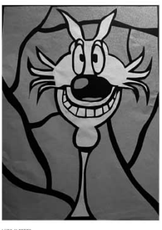
LAST MINUT | 19 | LUPO ALBERTO