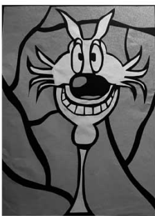
LAST MINUT 19 LUPO ALBERTO