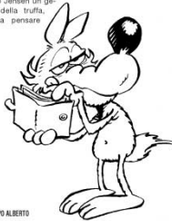
BUFALE IN RETE 18 LUPO ALBERTO

che questa storia potesse essere una fake. Già infatti i Bitcoin sono una valuta digitale virtuale che non esiste in forma di monete o banconote. Altra bufala archiviata. Passate parola.